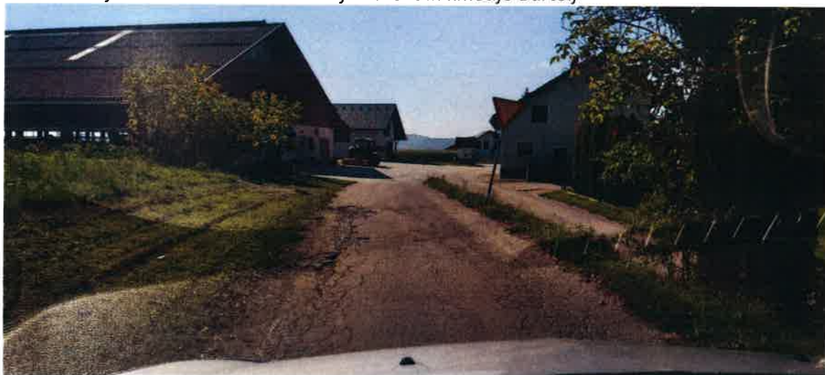
Slika: Dotrajan odsek ceste med kmetijo Kurent in kmetijo Bartolj