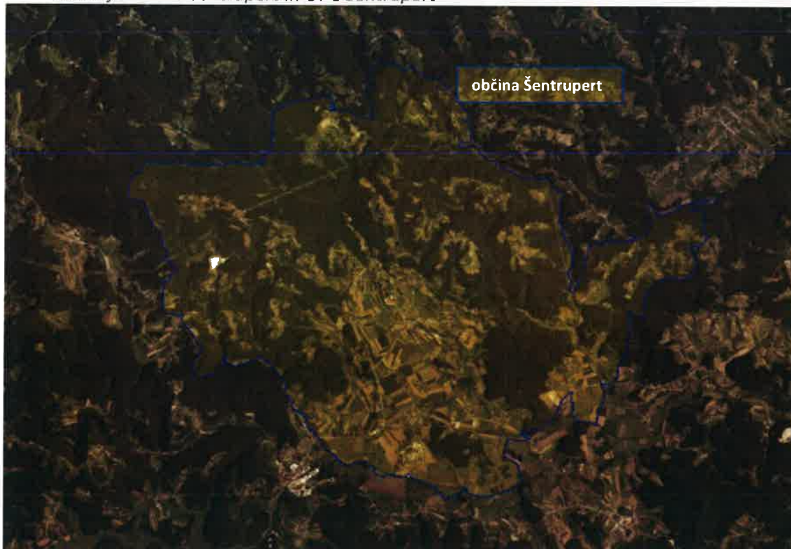
Slika: Lokacija občine Šentrupert in OPC Šentrupert