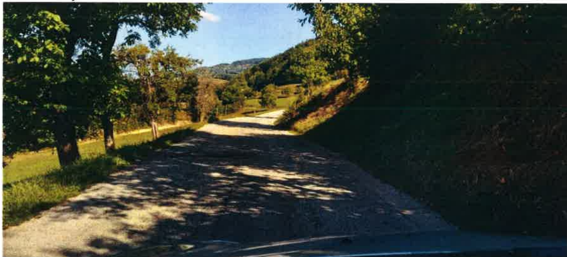
Slika: Dotrajan odsek ceste Hom – Ravne nad Šentrupertom