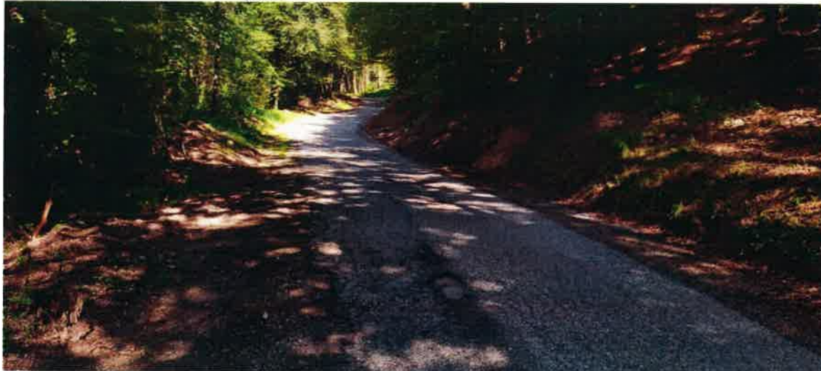
Slika: Dotrajan odsek ceste proti Hrastnem