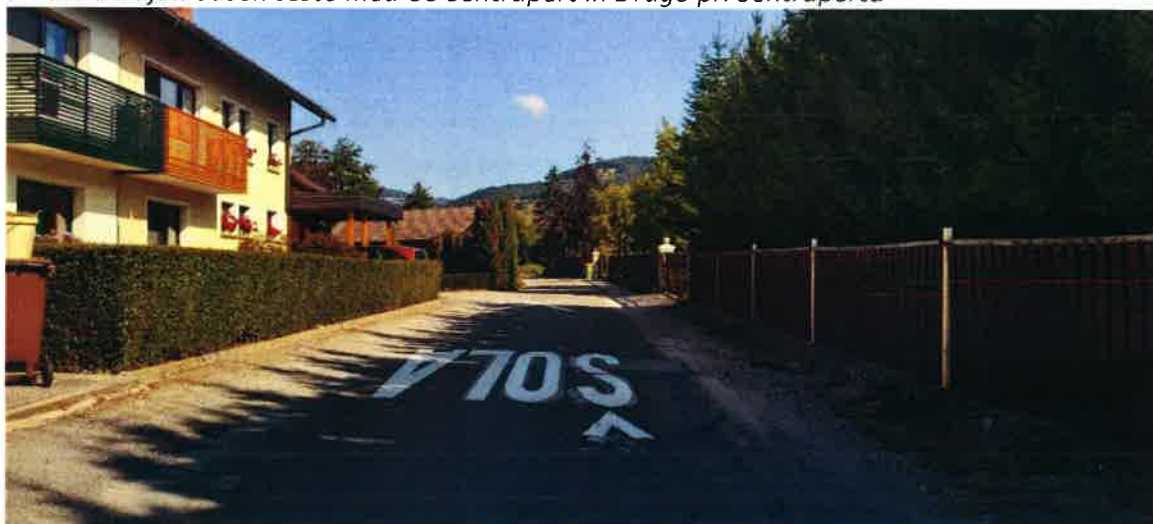
Slika: Dotrajan odsek ceste med OŠ Šentrupert in Drago pri Šentrupertu